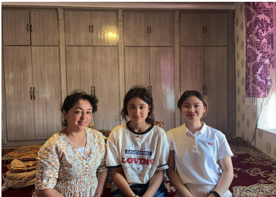
图 9 暑假家访

八是完善评价机制。结合各岗位育人规范、目标管理考核细则，建立完善公平、公正、科学的监督考核评价机制，把育人工作纳入评价体系，完善评价制度，细化评价内容。教师要把教学工作和班级管理成效、指导学生学习成效等联系起来，把学生评价、教师互评和领导评价结合起来，特别是要把教师担任班主任工作作为育人的导向。参照教师评价激励机制，对行政管理和教辅人员等建立相应的育人评价激励机制，从而使全方位、全身心、全员、全过程育人真正落到实处。