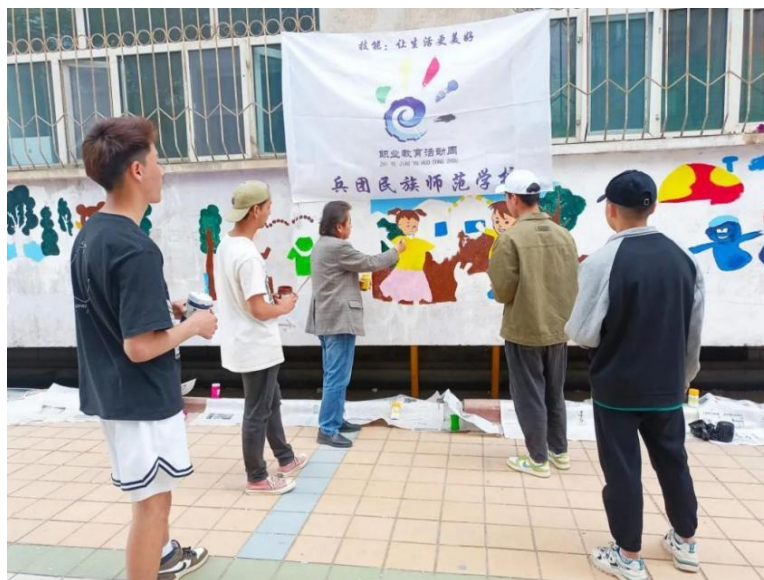
图 2 职业教育进社区

构建和谐校园与和谐社会，学校着力推进素质教育，促进人的全面发展。学校德育是全面实施素质教育的重要组成部分，构建以立德树人为根本的德育价值观，在传承传统道德文化的基础上，最大限度地融入时代精神，围绕着学校培养目标，实现德育的创新和发展，为把学校办成让人民满意的教育提供强有力的思想保证。