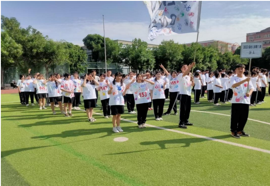
图 8 学校春季运动会

六是发展课外活动。学校和班级有计划地在课余时间组织学生开展丰富多彩的科技、文娱、体育等活动。通过课外活动，丰富学生的课余生活，扩展学生的知识视野，发展学生的个性特长，培养学生的美好思想品质、意志性格和生活情趣，提高他们的审美能力。