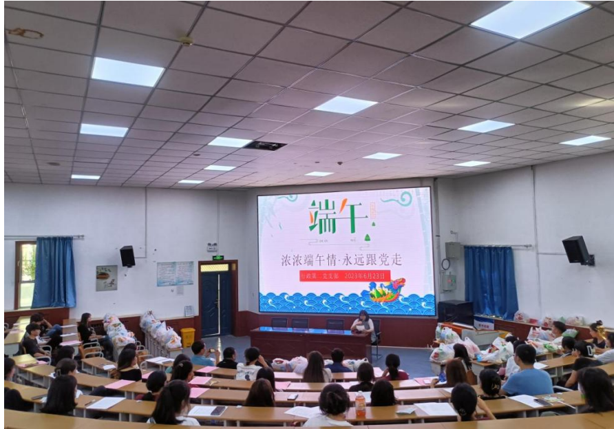
图 15 端午节活动