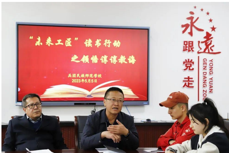
图 10 “未来工匠”读书分享会

我校在 2023 年兵团职业院校传承中华优秀传统文化素养大赛中，经典名篇诵读《水调歌头》荣获二等奖，中国民族舞蹈集体舞荣获二等奖。