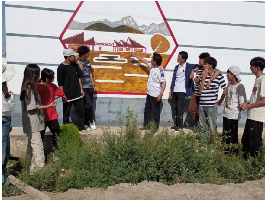
图 12 2021 级绘画班暑假墙绘活动

综合实践的育人功能，构建起涵盖生活劳动、服务性劳动和专业技术劳动课程的劳动教育课程体系，覆盖全部专业、全部年级：一年级通过劳动周、班级建设等活动，注重学生劳动习惯的养成；二年级通过各专业的社团服务、义工服务等，让学生在感受到劳动辛苦的同时体验劳动的乐趣和收获；三年级则通过学生参加实习，培养职业习惯和职业道德，成为准职业人。通过劳动教育课程，实现劳动课程教学实践化，让学生在常态化参与生产的过程中，实现对技能知识和专业知识的掌握，逐步养成“现代工匠精神”。