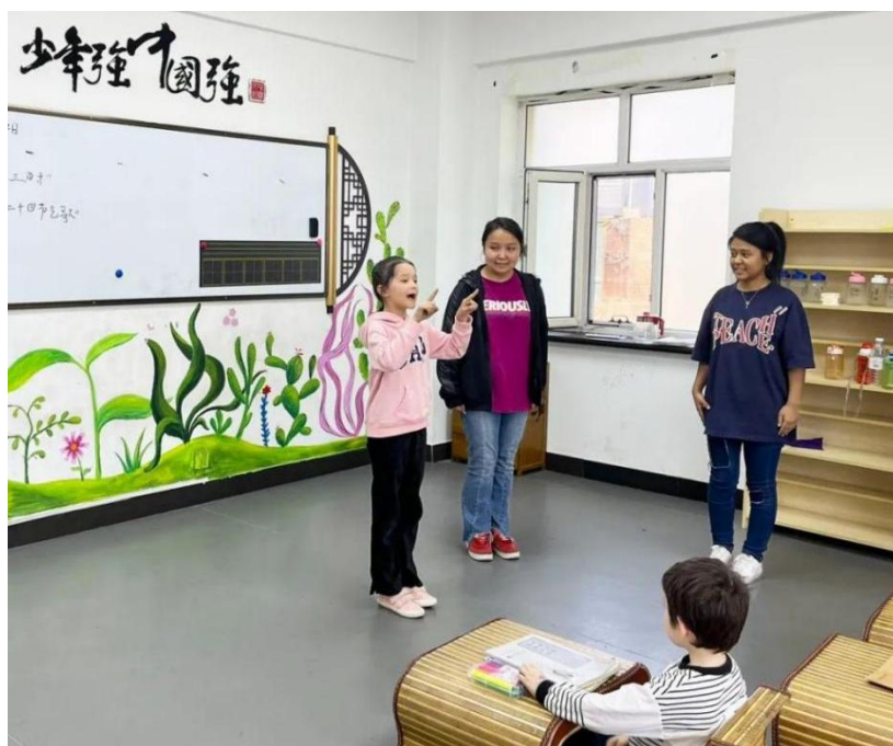
图 4 幼儿保育专业学生实习体验

为进一步加强学校德育工作的针对性、实效性和主动性，健全“三全育人”体制机制，要将立德树人落实在学校工作的各领域、各方面、各环节，渗透到校园生活的各个角落，落实全员育人责任。结合我校的具体情况，针对性加强对学生的德育教育：