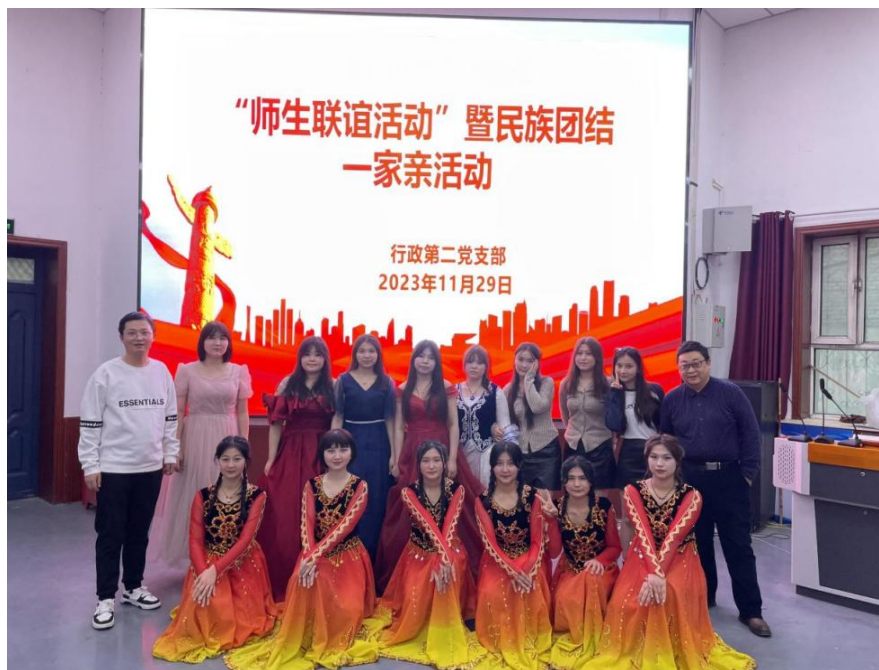
图 18 民族团结一家亲联谊活动