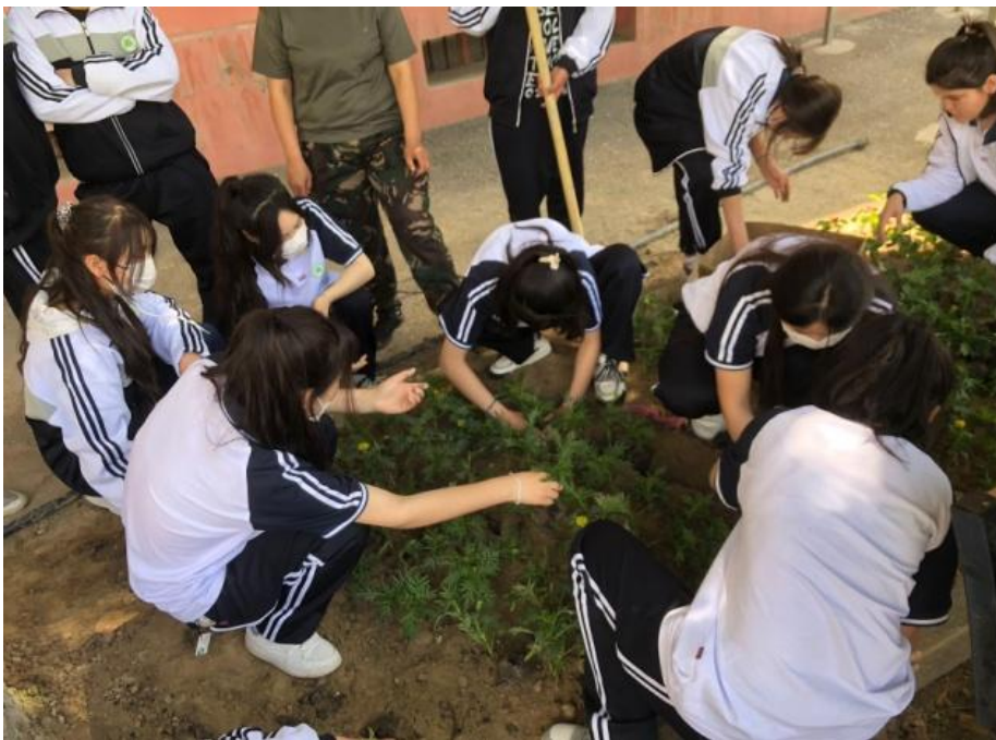
图 11 校园绿化活动

（2）细化校内外劳动实践流程，培育精益求精的“现代工匠精神”。学校今年开始实行标准化管理，提高服务育人能力。教官配合学生科、班主任具体负责班级和学生的服务与管理工作，学校校风、学风步入良性循环轨道。在教官和班主任的督促下，在全员参与教室、宿舍卫生保洁的过程中，培养了学生良好的劳动卫生习惯，通过日常锻炼，学生们的“工匠精神”的理念也潜移默化地建立起来。