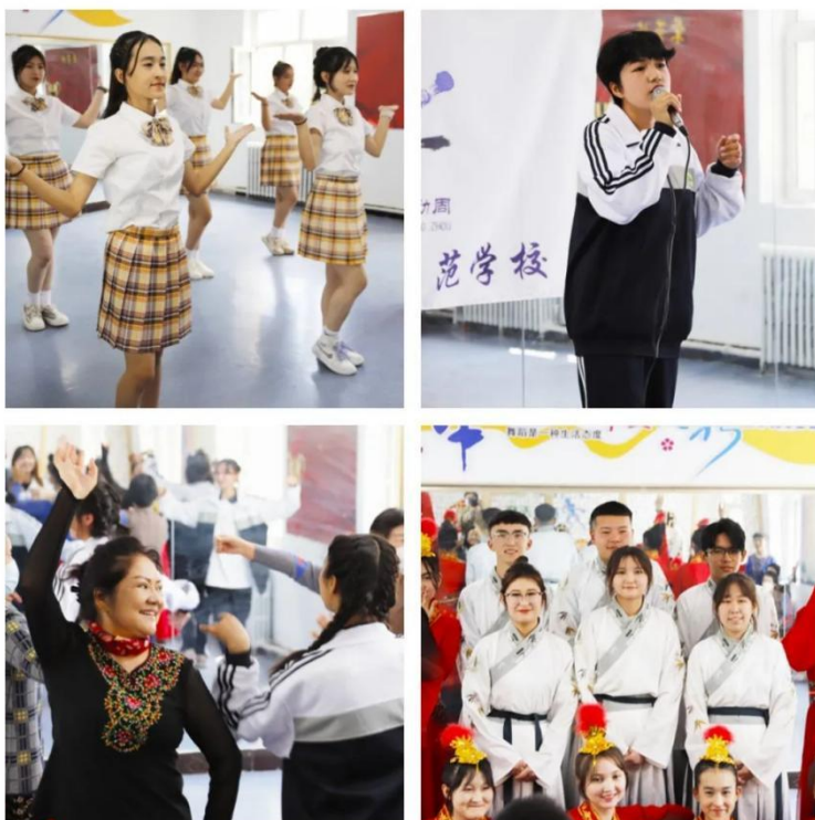
图 17 学生走进社区服务群众

“服务区域经济社会发展”是职业学校的任务和使命。学校已经成立 39 年，学校的发展离不开社会的支持，学校依托周边社区和企业资源，解决了学生专业实习的难题。为回馈社区，将志愿服务融入基层社会治理，为社区及城市发展注入青春动能。我校组织老年人服务与管理专业学生代表赴金谷社区老年人日间照料站开展社会实践结对共建活动，为老人们分发水果包，并发挥专业特长为爷爷奶奶表演精彩的节目。内容丰富的专业实践活动，一方面给社区居民带来艺术享受，另一方面也展示了学校的育人成果。