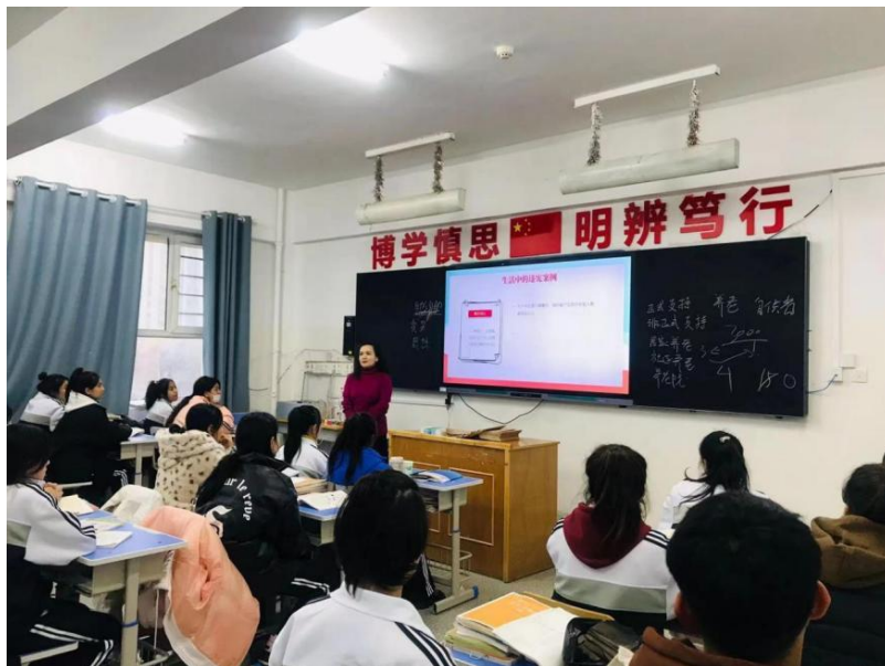
图 6 学宪法主题班会

四是以家长为依托培育和谐的家庭教育。通过家校联系、家访等活动，使家长真正了解家庭教育应当由经验育人向科学育人转变，由片面注重学习书本知识向注意引导孩子正确做人转变，由简单命令向平等沟通转变。在形成和谐家庭教育的同时，也延伸和促进了学校教育的发展。