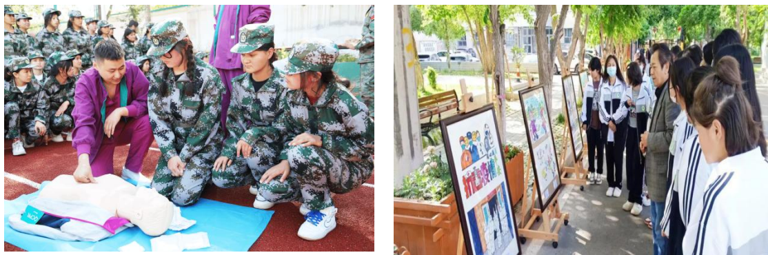
图 16 学生活动

坚持以立德树人为导向，克服“唯分数”的评价方式，坚持以促进学生全面发展为本，加强课后服务管理，开展丰富多彩的活动，满足学生的个性化发展，促进学生身心健康；完善学籍管理制度，探索多层次综合性管理，在探索性、实践性、综合性作业设计上多下功夫，促进学生持续发展。