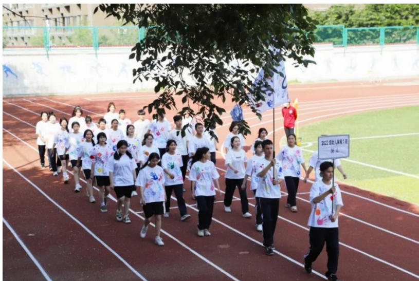
图 3 运动会开幕式