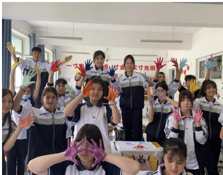
图 13 学生手工课

（2）有力促进了师资队伍的建设。教师积极参与到劳动教育课程开发和课题研究当中，目前已开发了手工等劳动教育校本课程。