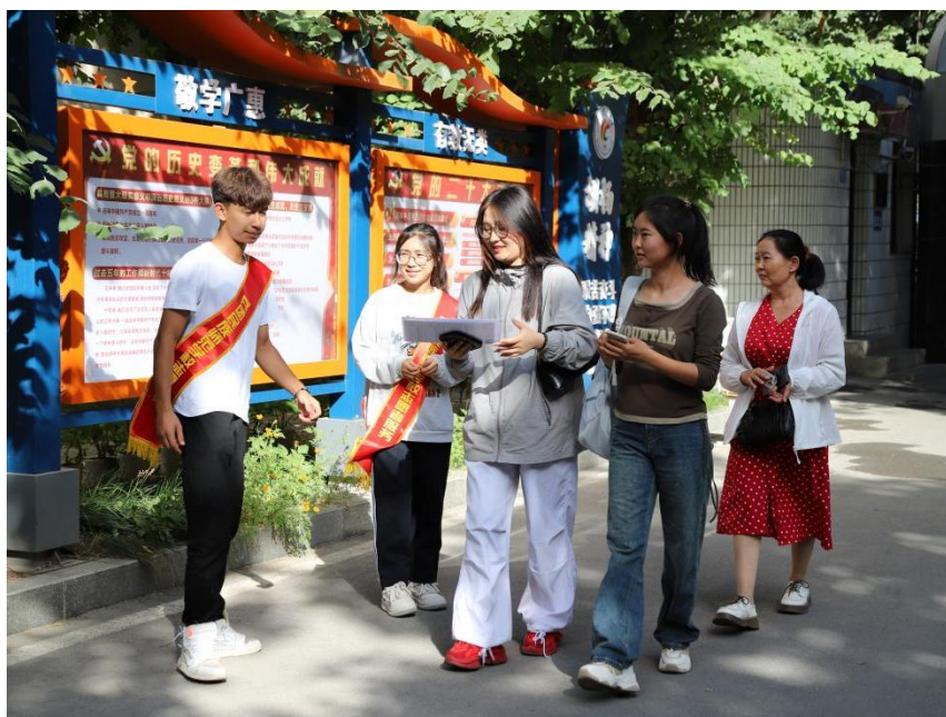
图 7 新生入学

四是以家长为依托培育和谐的家庭教育。通过家校联系、家访等活动，使家长真正了解家庭教育应当由经验育人向科学育人转变，由片面注重学习书本知识向注意引导孩子正确做人转变，由简单命令向平等沟通转变。在形成和谐家庭教育的同时，也延伸和促进了学校教育的发展。