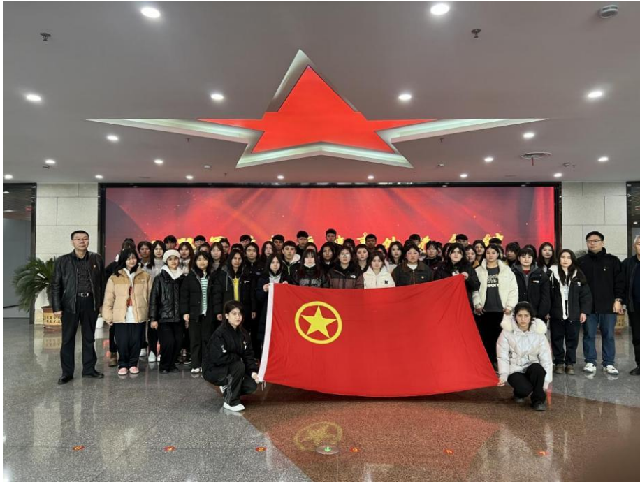
图 5 参观八路军办事处

生树立正确的人生观、价值观、荣辱观，增强学生热爱祖国、服务人民的使命感和责任感。