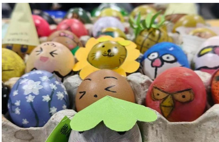
图 14 学生手绘作品